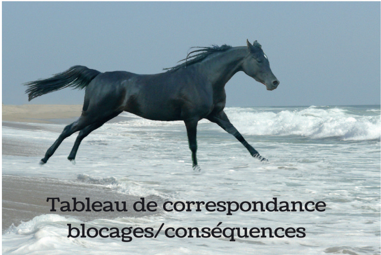
Tableau de correspondance blocages/conséquences